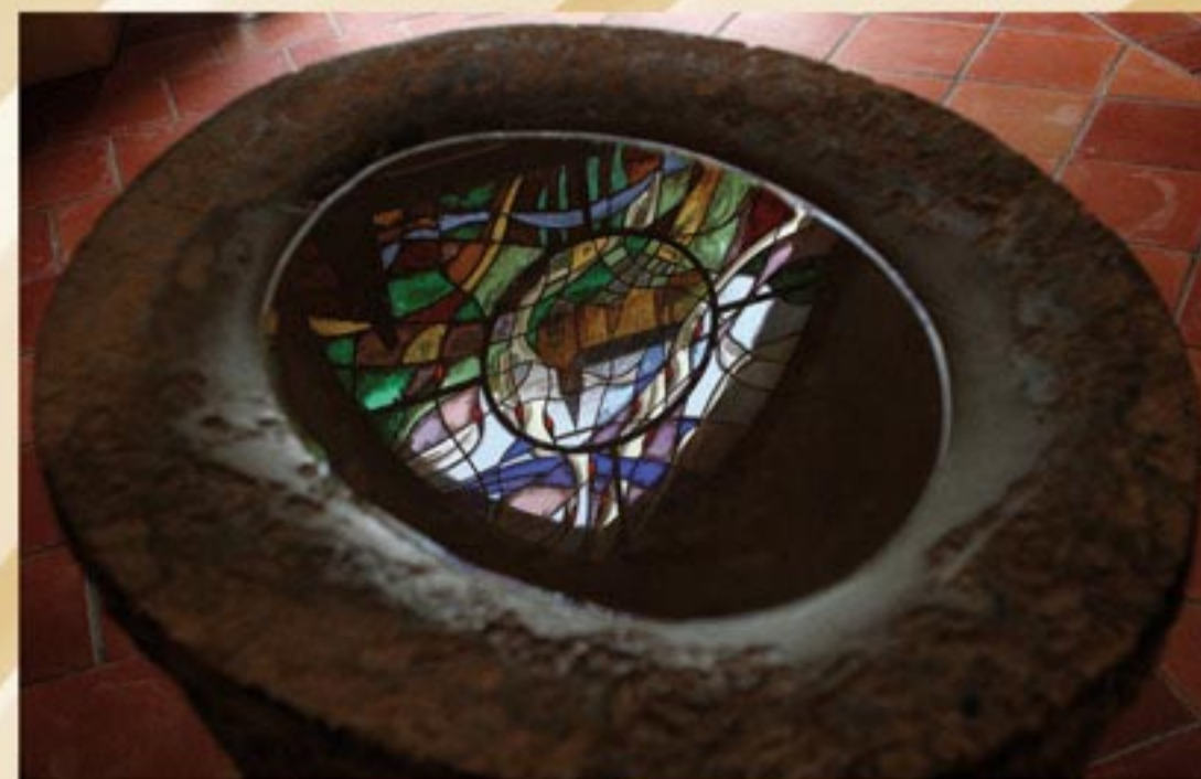
Bénitier en pierre, assemblé, XV ème