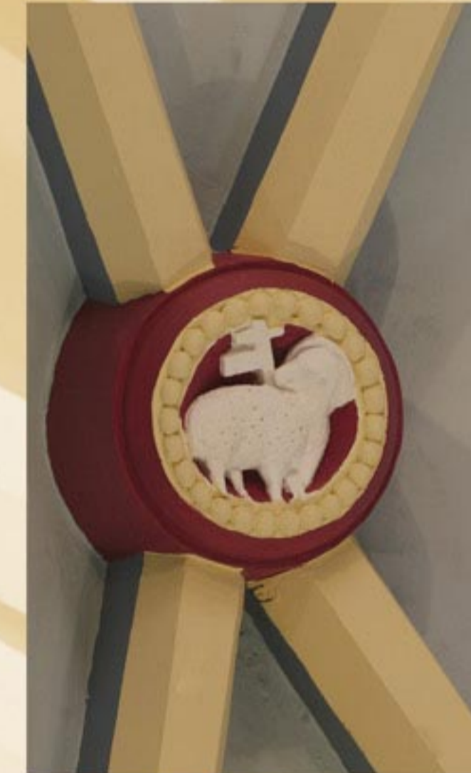
Clef de voûte romane