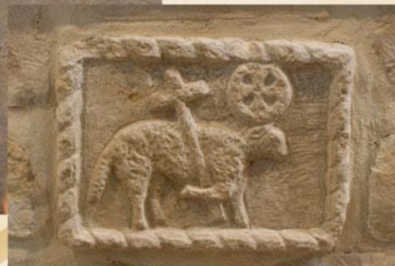
Ecusson, agneau portant la croix