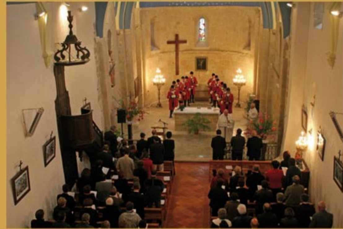
Inauguration de l'église Saint Jean-Baptiste, 16 Octobre 2010.