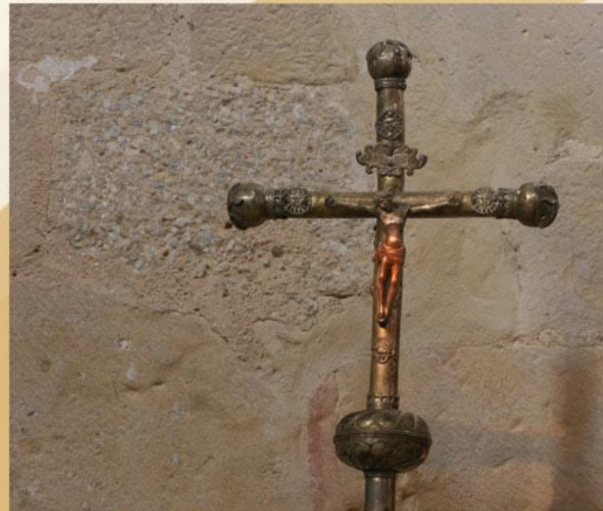
Croix de procession, classée, XVII ème .